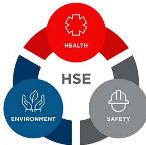
ایمنی، سلامت و محیط زیست - HSE

سلامت، ایمنی، و محیط زیست ۱ (HSE) از سال ۱۸۸۵ با هم مطرح شدند و هر جا که ایمنی مطرح شده، بهداشت و محیط زیست نیز در کنار آن آمده است. مباحث ایمنی پس از انقلاب صنعتی به دلایل افزایش آمار مرگ کارگران مطرح گردید. محیط زیست نیز پس از انقلاب صنعتی به وجود آمد و مطرح گردید. همچنین، به دلیل شرایط و سنگینی کار در معادن و افزایش بیماری‌های ناشی از کار در میان کارگران، بحث بهداشت نیز مطرح گردید و در گام بعدی ارتباط میان بیماری و وقوع حادثه کشف شد. یعنی پی بردند که وقتی کارگری بیمار شود، حادثه می‌آفریند یا اینکه دچار حادثه می‌شود. با افزایش بیماری‌ها، حوادث نیز افزایش می‌یابد و اینها به گونه‌ای به یکدیگر متصل هستند. کلیه اقدامات بشر، از جمله فعالیت‌های صنعتی، عمرانی و ساختمانی می‌باید در خدمت انسان و به منظور ارتقاء سطح زندگی مادی و معنوی او باشد. HSE علاوه بر چهارچوب انسانی و اخلاقی آن، از نظر اقتصادی نیز می‌تواند مد نظر قرار گیرد.